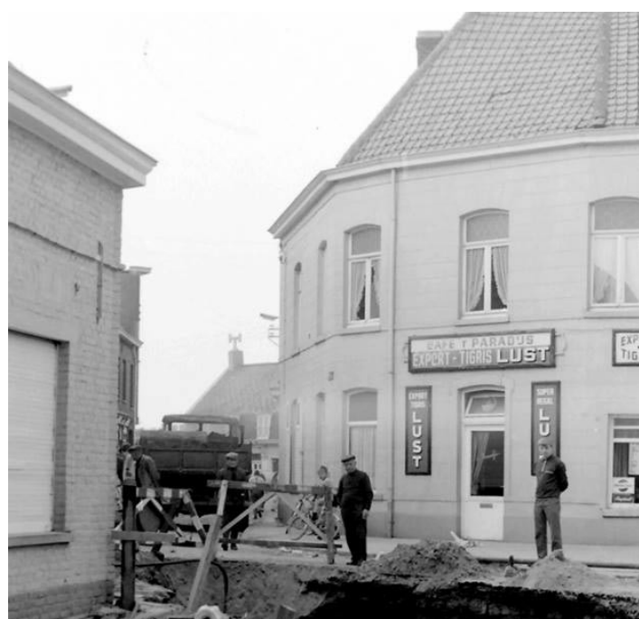
Jaartal en fotograaf onbekend